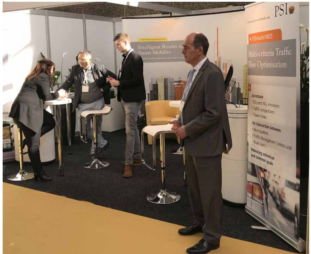
PSI präsentierte innovative Smart-City-Lösungen für die Mobilität von morgen.

Durch Erweiterungen und Integration der mobilen Lösung des niederländisch-deutschen Smart-Mobility-Experten V-TRON wurden die Voraussetzungen zur intelligenten Verkehrsflusssteuerung in Smart Cities geschaffen. Das App-basierte Incentive-System ZOOFF ermöglicht den Einsatz in urbanen Infrastrukturen mit geringer bis fehlender Telematik und erhöht die Akzeptanz bei den Verkehrsteilnehmern. Messteilnehmer hatten zusätzlich die Gelegenheit, sich in einem Key-